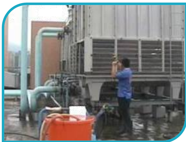
冷卻水塔清潔保養