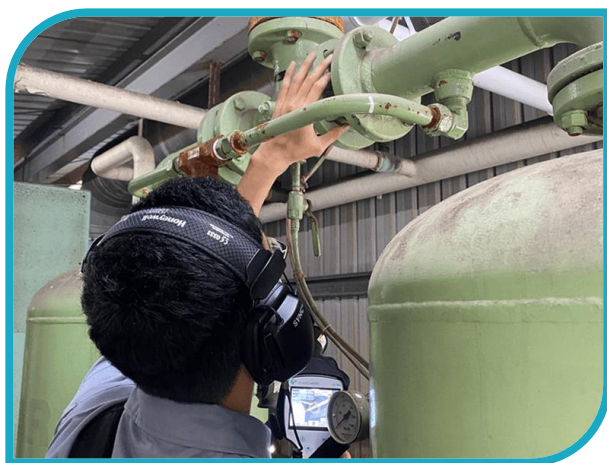
修補空壓管線洩漏