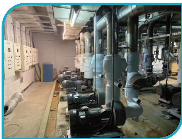
汰換為IE3以上之高效率馬達